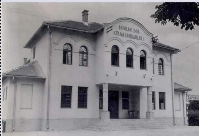
Privatna fotografija, obitelj Dujković